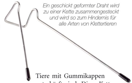
Ein geschickt geformter Draht wird zu einer Kette zusammengesteckt und wird so zum Hindernis für alle Arten von Klettertieren

Tiere mit Gummikappen entschärft sind. Diese Kette wird einfach um das Regenrohr gelegt und durch das Zusammenklicken der beiden Enden befestigt, oder mit den zum Lieferumfang gehörenden Kabelbindern verbunden. Sie verhindert zuverlässig, dass ein Marder an dem Rohr hochklettert. Der Gürtel sollte jedoch in einer Höhe positioniert werden, die sicherstellt, dass sie außerhalb der Reichweite von Kindern ist, um Unfälle mit den abstehenden Dornen zu vermeiden. Mit seinem Preis von rund 8 Euro pro Gürtel haben wir ihn in die Einstiegsklasse eingeordnet. Hier erreicht er ein gut bis sehr gut im Preis-Leistungs-Verhältnis.